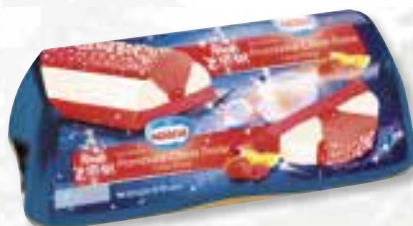
«Sensation Framboise Citron Fraise» Framboos Citroen Aardbei 1000 ml 08 08 60