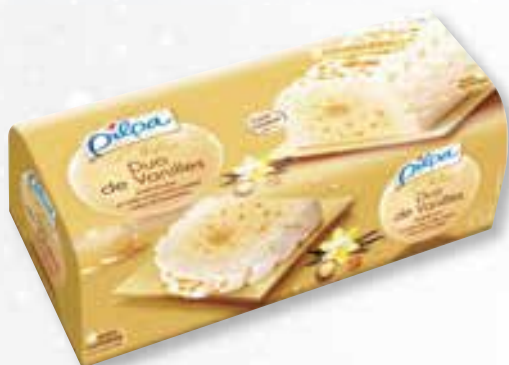
«L'Infinie Duo de Vanilles» Gl. vanille, macadamia, s. vanille Vanille-ijs, macadamia, vanille saus 1000 ml 15 16 44