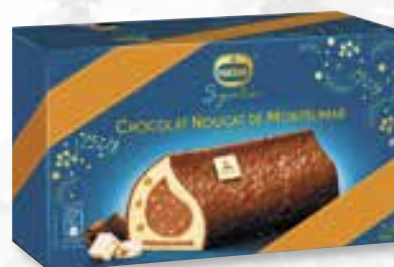
«Choco. nougat de Montélimar» Noix de pécan caramélisées Gekarameliseerde pecannoten 800 ml 08 07 75