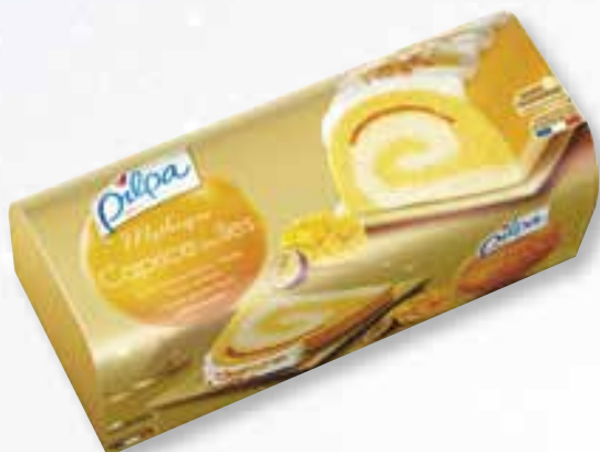
«Mythique Caprice des Îles» Sorbet Fruits Exot./Vruchten - Vanille Sauce/Saus exot. - 1000 ml 15 16 20