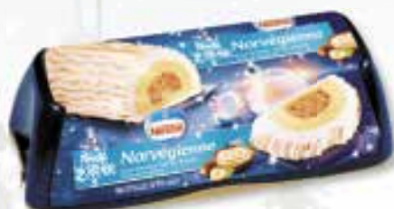
«Norvégienne» 1000 ml 08 08 33