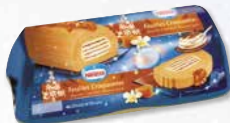
«Feuilles craquantes» Vanille Caramel beurre salé 1000 ml 08 08 58