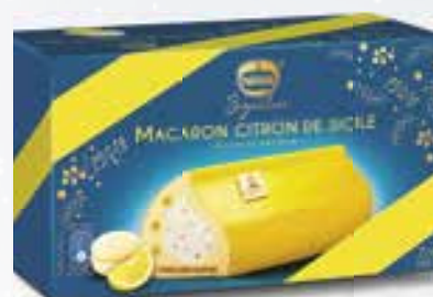
«Macaron Citron de Sicile» Éclats de macaron Roomijs Citroen, stukjes macaron 800 ml 08 07 72