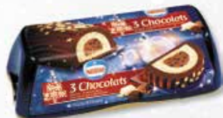
«3 Chococats» 3 Chocolade 1000 ml 08 08 22