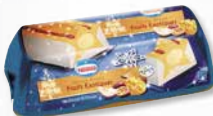
«Délice Étoilé Fruits Exotiques» Exotische vruchten 1000 ml 08 08 24