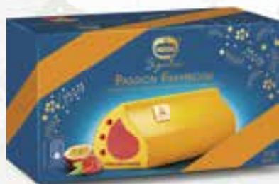
«Passion Framboise» S. fruits de la passion d'Equateur S. Framboos en Passievruucht uit Ecuador 800 ml 08 07 73