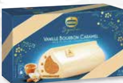
«Vanille Bourbon Caramel» Noix de pécan caramélisées Gekarameliseerde pecannoten 800 ml 08 07 74