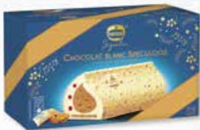
«Chocolat blanc spéculoos» Sauce aux fruits rouges 800 ml 15 16 58