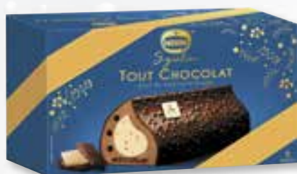
«Tout Chocolat» Avec du chocolat blond Met melkchocolade 800 ml 08 07 66