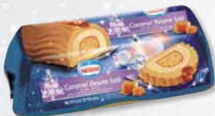
«caramel beurre salé» Karamel gezouten boter 1000 ml 08 08 13