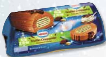
«Feuilles craquantes» Chocolat Pistache 1000 ml 08 08 57