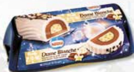
«Dame blanche» 1000 ml 08 08 35