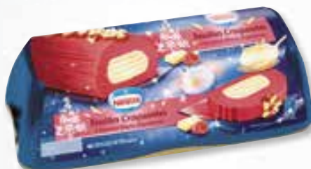
«Feuilles craquantes» Chocolat blanc Framboise 1000 ml 08 08 59