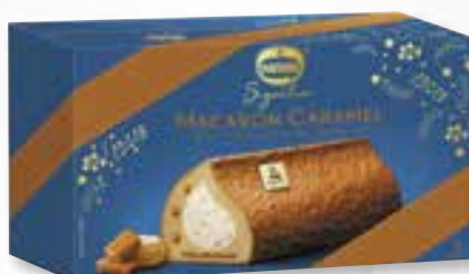
«Macaron Caramel» Glace au caramel beurre salé Roomijs met gezouten boter 800 ml 08 07 69