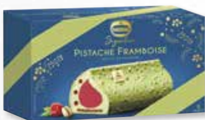
«Pistache Framboise» Eclats de pistache Pistache Framboos Stukjes pistache 800 ml 08 07 62