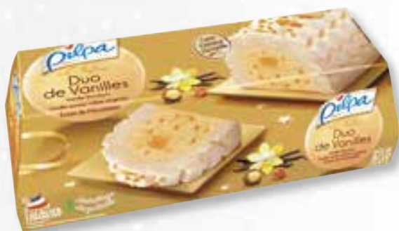
«L'Infinie Duo de Vanilles» Gl. vanille, macadamia, s. vanille Vanille-ijs, macadamia, vanille saus 1000 ml 15 16 44