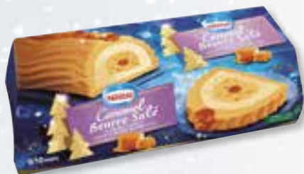
«caramel beurre salé» Karamel gezouten boter 1000 ml 08 08 18