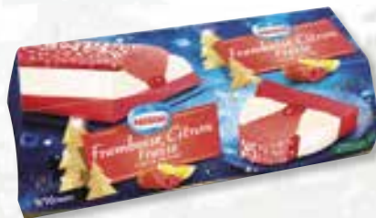
«Sensation Framboise Citron Fraise» Framboos Citroen Aardbei 1000 ml 08 08 60