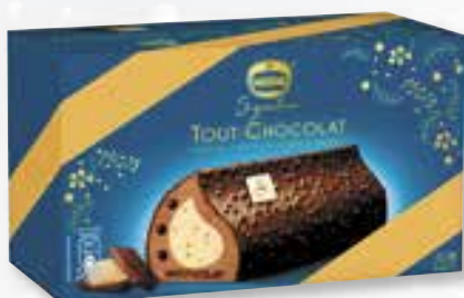
«Tout Chocolat» Avec du chocolat blond Met melkchocolade 800 ml 08 07 66