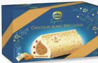
«Chocolat blanc spéculoos» Sauce aux fruits rouges 800 ml 15 16 58