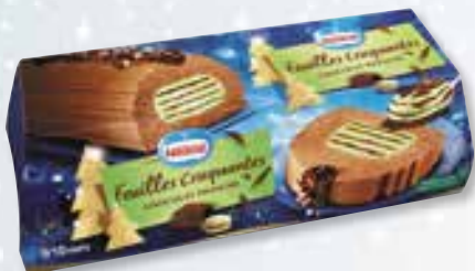
«Feuilles craquantes» Choclat Pistache 1000 ml 08 08 57