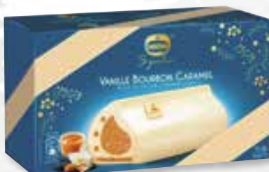
«Vanille Bourbon Caramel» Noix de pécan caramélisées Gekarameliseerde pecannoten 800 ml 08 07 74