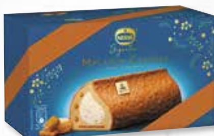
«Macaron Caramel» Glace au caramel beurre salé Roomijs met gezouten boter 800 ml 08 07 69