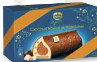
«Choco. nougat de Montélimar» Noix de pécan caramélisées Gekarameliseerde pecannoten 800 ml 08 07 75