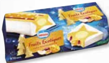
«Délice Étoilé Fruits Exotiques» Exotische vruchten 1000 ml 08 08 24