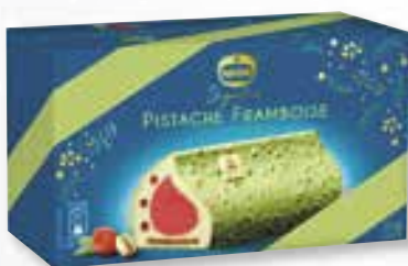
«Pistache Framboise» Eclats de pistache Pistache Framboos Stukjes pistache 800 ml 08 07 62