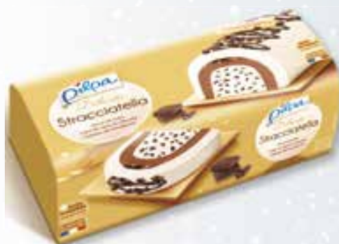
«Délicate» Stracciatella 1000 ml 15 16 52