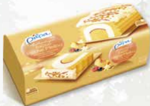
«L'Authentique façon pêche Melba» Sorbet pêche, glace vanille, amandes caramélisées Sorbet perzik, Vanille-ijs, gekaramelis. amandelen 1000 ml 15 16 62