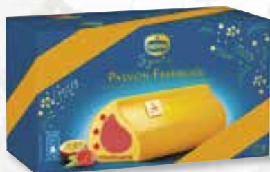
«Passion Framboise» S. fruits de la passion d'Equateur S. Framboos en Passievrucht uit Ecuador 800 ml 08 07 73