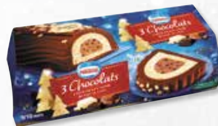
«3 Chocolats» 3 Chokolade 1000 ml 08 08 22