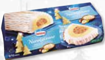
«Norvégienne» 1000 ml 08 08 33