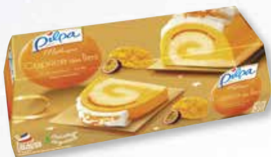
«Mythique Caprice des Îles» Sorbet Fruits Exot./Vruchten - Vanille Sauce/Saus exot. - 1000 ml 15 16 20