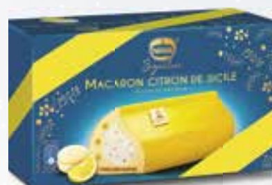
«Macaron Citron de Sicile» Éclats de macaron Roomijs Citroen, stukjes macaron 800 ml 08 07 72