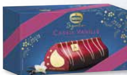
«Cassis Vanille» Vanille Bourbon 800 ml 08 07 65