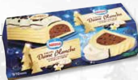
«Dame blanche» 1000 ml 08 08 35