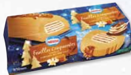
«Feuilles craquantes» Vanille Caramel beurre salé 1000 ml 08 08 58