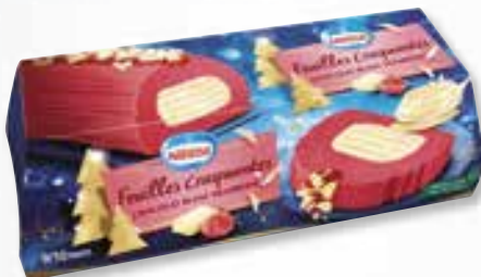
«Feuilles craquantes» Choclat blanc Framboise 1000 ml 08 08 59